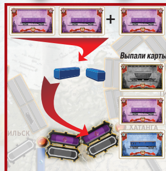
Пример 1 Играются две фиолетовые карты, выпала еще одна фиолетовая карта, необходимо на одну карту больше