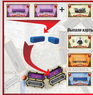
Пример 4 Играются две фиолетовые карты, выпала карта контролёра, необходимо добавить карту локомотива

Если игрок использует одну и ту же станцию для выполнения нескольких маршрутов, он должен использовать один и тот же маршрут. До конца игры игрок не обязан указывать, какой именно маршрут он будет использовать.