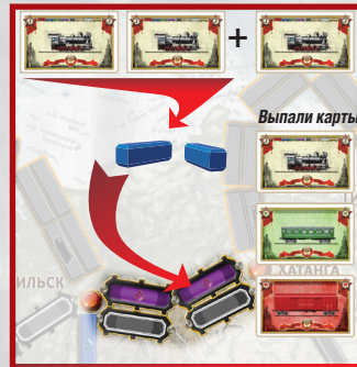
Пример 3 Играются две карты локомотивов, выпала еще одна карта локомотива, необходимо на одну карту больше